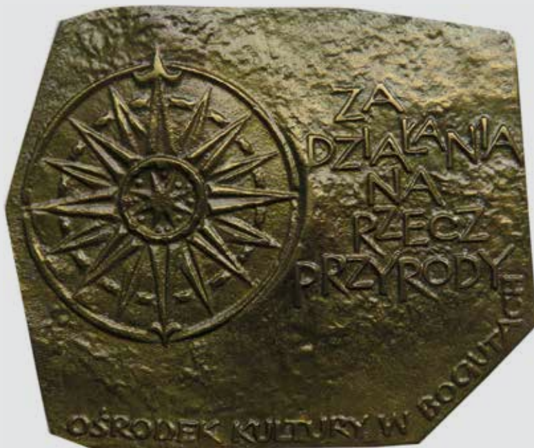
Awers i rewers Medalu im. Wiktora Godlewskiego „Za działania na Rzecz Przyrody”