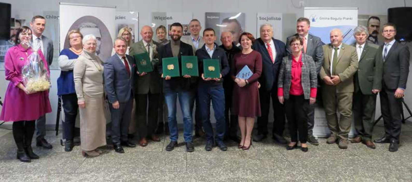
Na pamiątkę spotkania. Laureaci, członkowie kapituły, władze samorządowe i zaproszeni goście