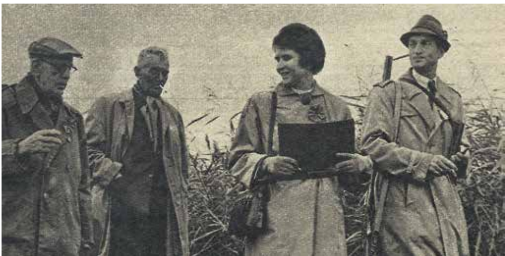
Ogólnokrajowe Konkursy Wyżłów w Krzyżu k. Tarnowa 6-7 października 1962 roku.