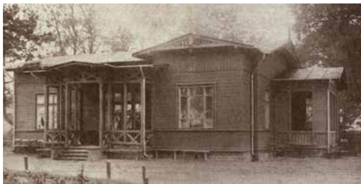
„Hubertówka” – siedziba Otwockiego Kółka Myśliwskiego im. Św. Huberta, pierwszy po wojnie ośrodek szkolenia psów myśliwskich

W Hubertówce – siedzibie Otwockiego Kółka Myśliwskiego otwarto pierwszy po wojnie ośrodek szkolenia psa myśliwskiego. Kolejne powstały w Mrokowie, Roźniatach, Skrzyńkach, Koszycach k. Tarnowa (1952) i Rębowoli (1953).