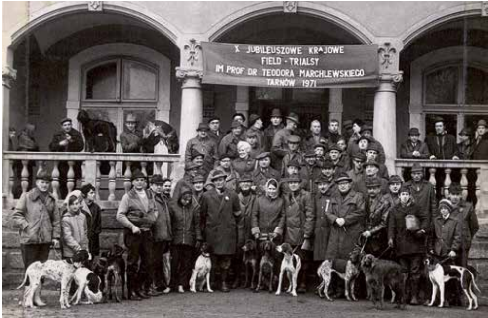
X Jubileuszowe Krajowe Field Trialsy im. prof. Teodora Marchlewskiego w Tarnowie w 1971 roku

36 wyzłów angielskich i kontynentalnych, przeprowadzono w Goszczy pod Krakowem 7 września 2003 roku. Organizatorami imprezy byli: ZG PZŁ, ZO PZŁ w Krakowie wraz z krakowskim oddziałem ZKwP (Szpetkowski 2003).