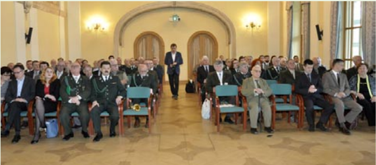
Uczestnicy seminarium w Kolegium Rungego Uniwersytetu Przyrodniczego w Poznaniu