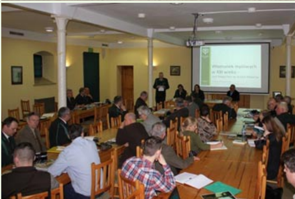
Redaktorzy czasopism łowieckich w OKL w Gołuchowie