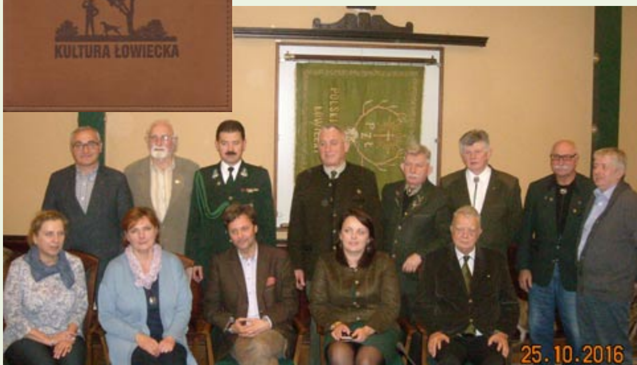
Spotkanie przedstawicielek Oficyny Wydawniczej „Forest” z autorami podręcznika