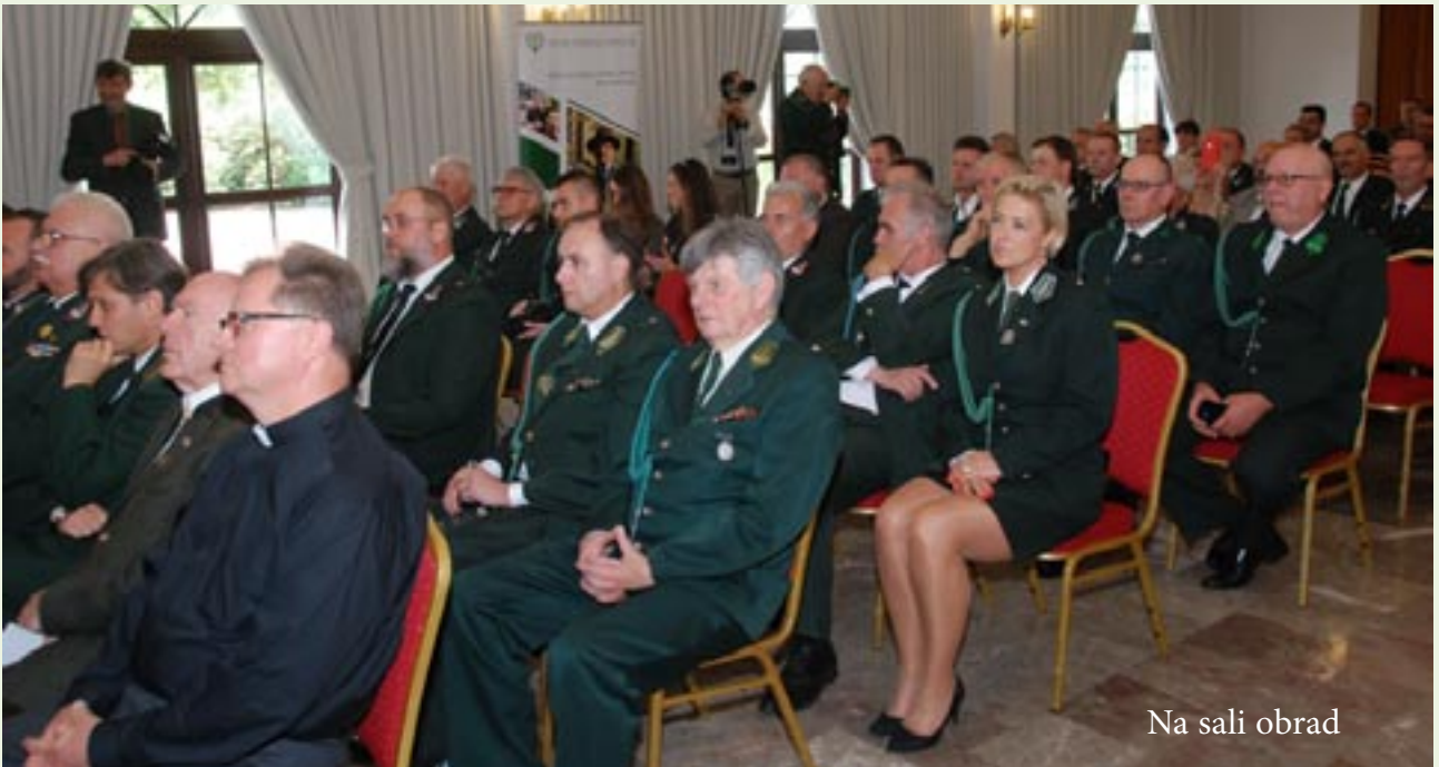
Na sali obrad